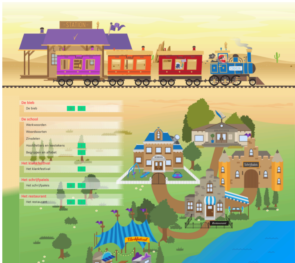
Afbeelding 2: Overzicht CODE26